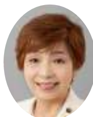
宮坂 良子 市議会議員