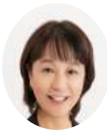
西村あつ子 市議会議員